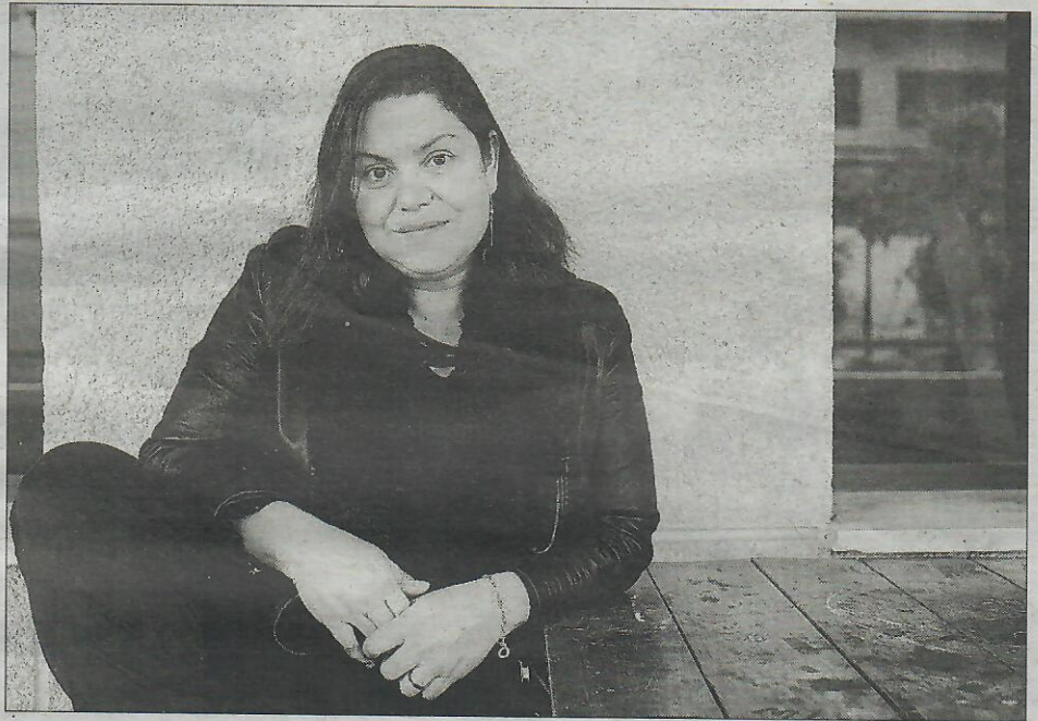
La escritora Care Santos recaló ayer en Palma en un viaje relámpago.

Advierte que la literatura para jóvenes «es literatura adulta que gusta a los adolescentes» y advierte que este género «ha sido un invento editorial». Como escritora «me interesan los adolescentes y lo que cuentan». Santos conoce muy bien este mundo ya que es madre de tres chicos de 17, 16 y 14 años. «Los adolescentes dan miedo y tienen mala fama, pero ahora mis hijos me gustan más que antes», explica.