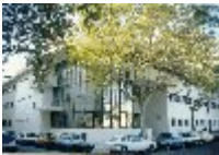
IES Ses Estacions (Palma de Mallorca. (Balears)