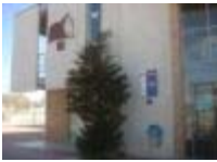
IES Profesor Domínguez Ortiz Azuqueca de Henares, (Guadalajara)