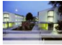
IES Francisco Figueras Pacheco (Alacant)