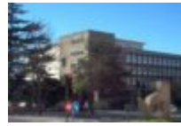
IES. San Tomé de Freixeiro (Vigo)